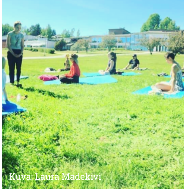
Kuva: Laura Madekivi